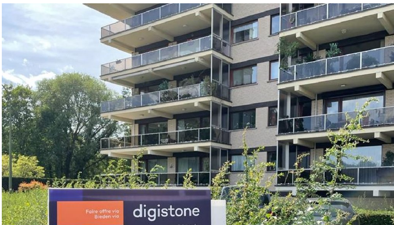
Digistone, la nouvelle plateforme belge de ventes en ligne, sort de sa phase de rodage.

PHILIPPE COULÉE | 18 septembre 2022 21:31