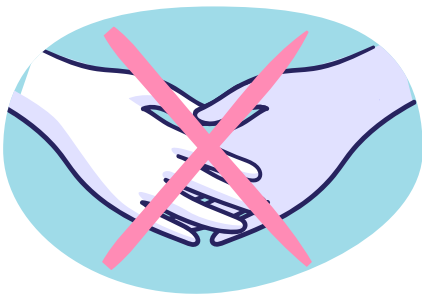
Schud geen handen