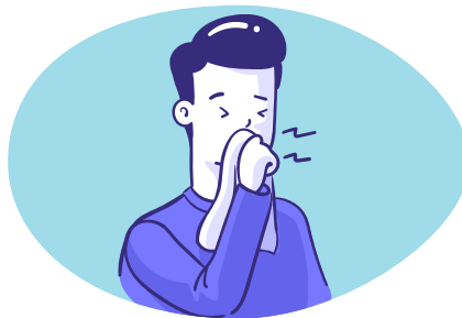
Hoest of nies in een papieren zakdoek