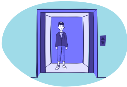
Beperk het aantal personen in de lift, hou afstand en sta rug naar rug