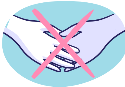
Schud geen handen