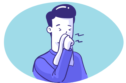
Hoest of nies in een papieren zakdoek