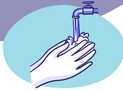
Was je handen bij het verlaten en het aankomen in je woning