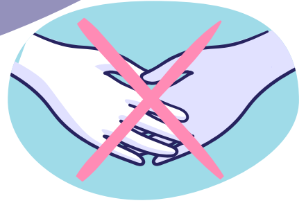
Schud geen handen