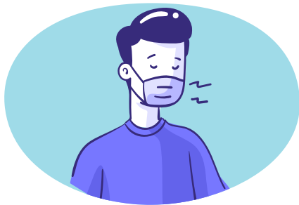
Draag beschermingsmiddelen en voorzie ontsmettingsmiddel aan de ingang(en) van de woning