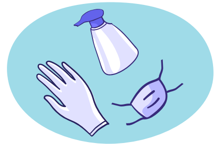
Indien social distancing niet mogelijk is, volg de instructies voor passende beschermings- en reinigingsmiddelen